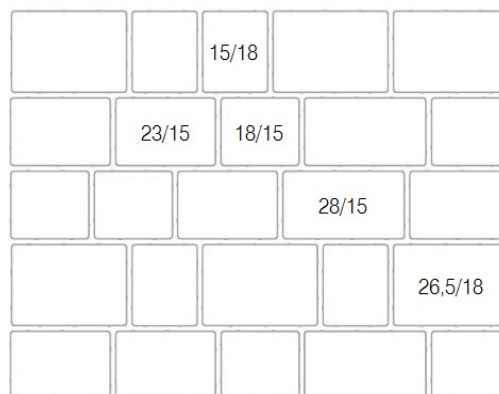
Rozloženie vo vrstve